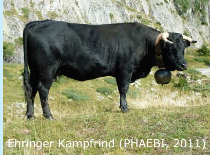
Ehringer Kampfrind (PHAEBI, 2011)

FACHHOCHSCHULE KIEL University of Applied Sciences